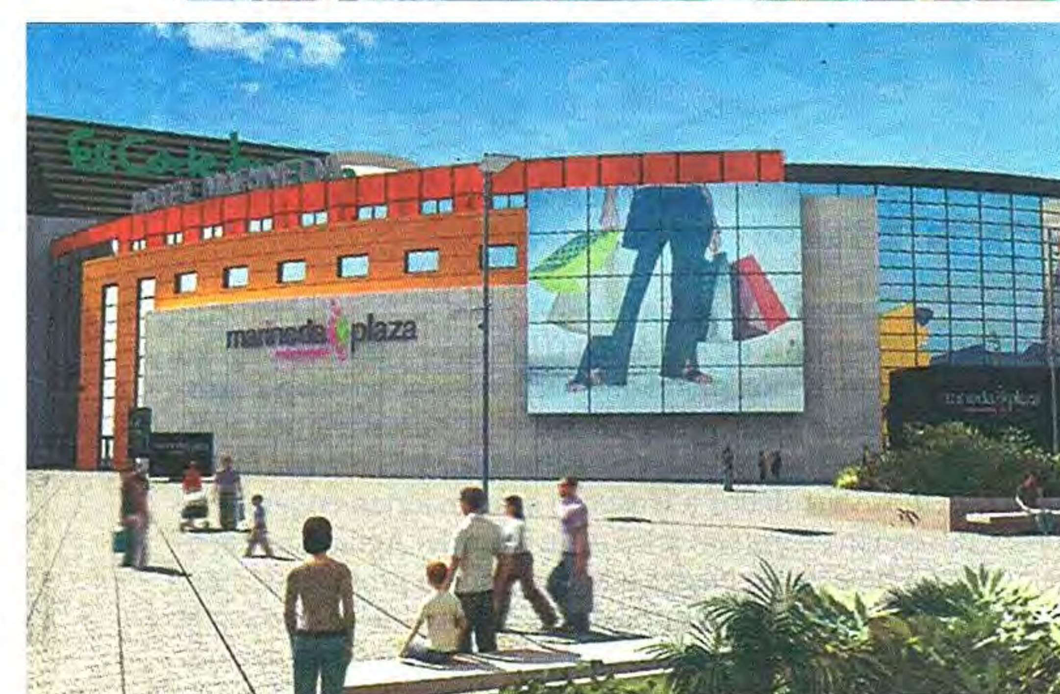
(imagen superior de la derecha).